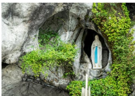
Gruta de Massabielle