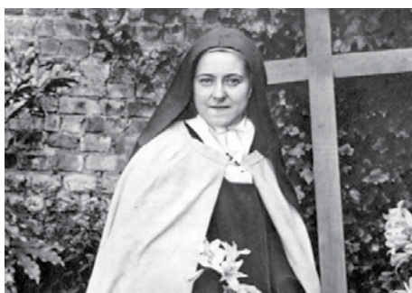
Santa Teresita de Lisieux