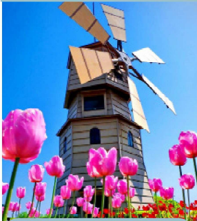
Molino de Viento en Holanda