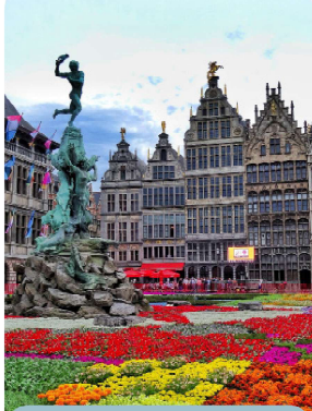
La Grand-Place Bruselas

Mar, 28 de Jul. Regreso a San Francisco no, sin antes, atesorar en nuestra memoria recuerdos inolvidables vividos durante este viaje.